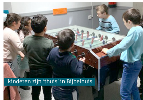
kinderen zijn 'thuis' in Bijbelhuis